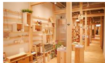
▲カフェ2階のショップ