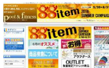
▲リニューアルを控える「繁盛ネット」